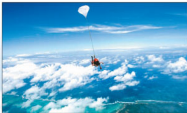
■ «Chaque jour est différent. Il y a des jours sans nuages, des jours avec.» Comme on n'a pas l'occasion de les approcher tous les jours d'aussi près, on en profite...

Maurice vue du ciel en sentant le vent sur votre visage alors que vous traversez les nuages. «Sky Dive Austral Ltée.» vous propose ses sauts en parachute en tandem au départ de Mon-Loisir. Avec l'adrénaline du saut dans le vide en prime... Or, ce n'est que le début. Car, «l'express» vous propose, cette semaine, une série de reportages hors des sentiers battus.