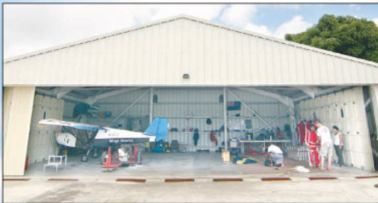
■ Alors que chacun enfle sa tenue avant de prendre place dans l'avion, les tandem-instructeurs expliquent les positions à adopter lors de la chute libre.