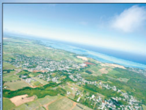
■ Au départ de Mon-Loisir, le «Cessna 182» survole les champs de cannes le temps de prendre de l'altitude, pour ensuite prendre la direction de la mer.